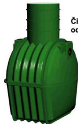
Čistiareň odpadových vôd

Spoločnosť EKOPROGRES je výrobcou ekologických výrobkov - čistiarní odpadových vôd certifikovaných podľa najnovšej európskej normy, nádrží na vodu, vodomerných šácht, kanalizačných šácht revíznych, domových aj prečerpávacích, kontajnerov na triedený zber odpadu, biokompostérov a vodiacich stien.